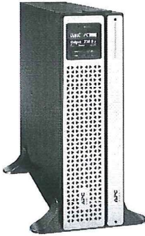
SRT2.2K & 3K series With Li-ion Battery Pack (Tower Mount)